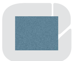
Azul claro 448