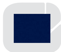
Azul oscuro 487