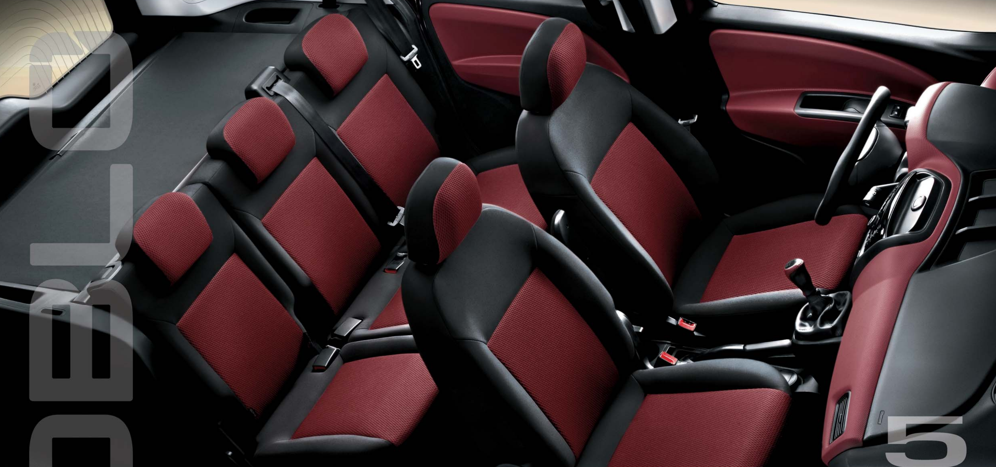
Gran flexibilidad interior, con la posibilidad de 5 a 7 asientos . Máximo espacio con maletero de 790 litros a 3.200 litros con los asientos traseros abatidos.