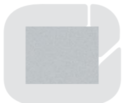
Gris claro 612